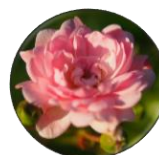
センチフォリアローズ