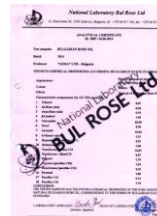
品質保証書（鑑定書）

ブルガリア国立バラ研究所に集荷され、完全遮光性の容器に充填後、封緘。劣化を防ぐとともに公的な承認の証となり、別途品質保証書も発行される。