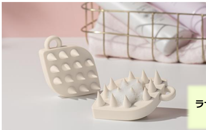
ラサーナ スカルプブラシ 2,200円(税込)

～ディープクレンジングとリラクスマッサージでツヤ髪に導く～ 毛髪診断士監修 “ダメージレスなスカルプブラシ”