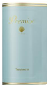
ラサーナ プレミオール トリートメント