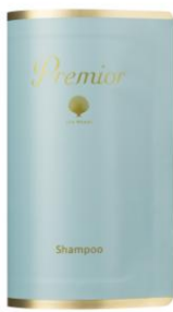
ラサーナ プレミオール シャンプー