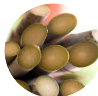
サトウキビ由来のスクワラン