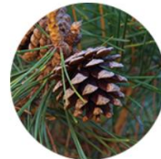
ゴヨウマツ種子油