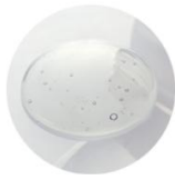
海由来 水溶性コラーゲン