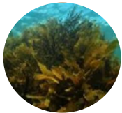
フランス・ブルターニュ産 海藻のエキス