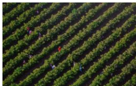
鶏や七面鳥による有機栽培（無農薬）