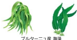
ブルターニュ産 海藻