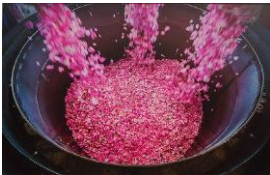
繊細な香りを守るため、水蒸気蒸留法にて抽出。