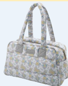
キルティング トートバッグ

<本リリース、製品や画像貸出に関するお問い合わせ> 株式会社ヤマサキ 東京支店 PR担当 TEL: 03-5766-5147 FAX: 03-3797-1808