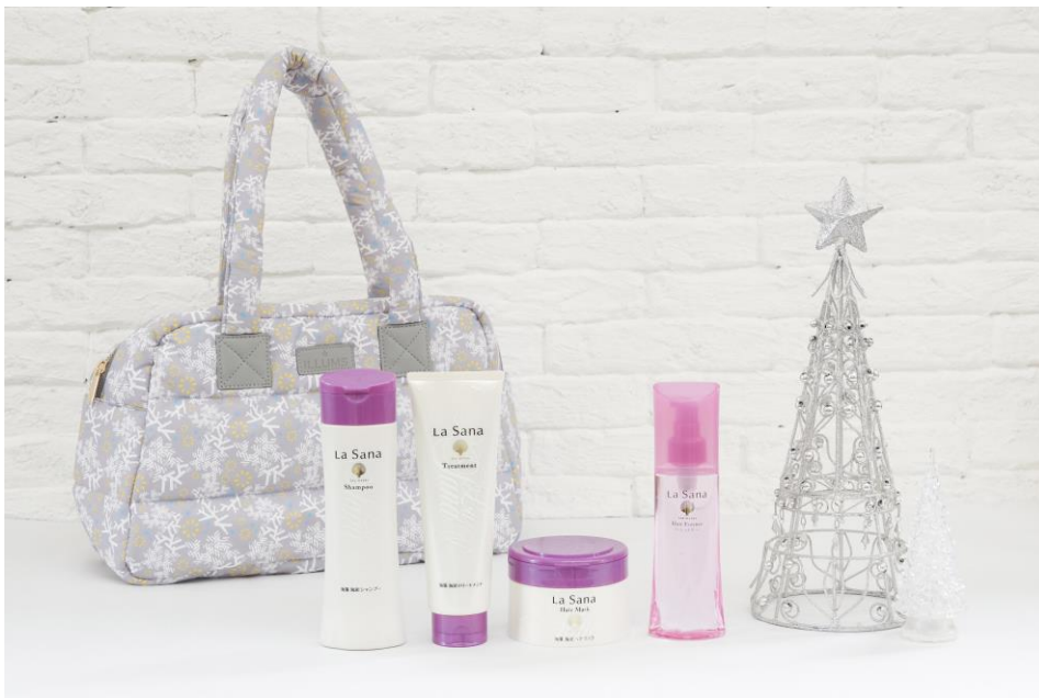
ラサーナ クリスマスコフレ しっとり