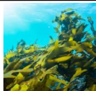
ブルターニュ産 海藻