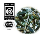
オリーブ油 (Skal 認証)