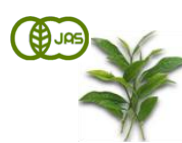
茶エキス (有機 JAS 認証)