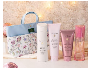
ラサーナ クリスマス コフレ ダメージ [しっとり]