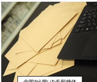
全国から届いた毛髪検体