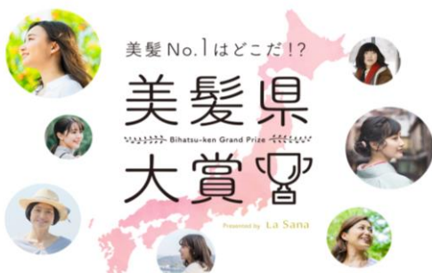
美髪県大賞専用ページ