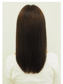
まとまりのある髪