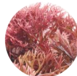
加水分解紅藻エキス