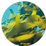
ラミナリアディギタータエキス

さまざまな髪のダメージに合わせた海藻のエキス※6を配合。ダメージ髪を集中補修します。