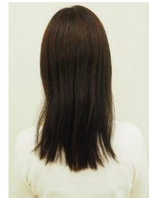
まとまりのない髪