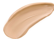
ナチュラルベージュ

黄みと赤みのバランスがよいオリジナルカラー「ナチュラルベージュ」を採用。 イエローベースにもブルーベースにもなじみやすく、ツヤ感のある明るい印象の肌に 仕上げます。