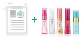
※毛髪診断書の画像はイメージです