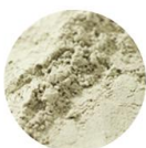
ブルターニュ産の海泥

超微粒子で、マイナスイオンを帯びた 海泥が、毛穴の汚れを吸着し、 高い洗浄力を発揮します。