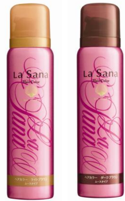
ライトブラウン ダークブラウン