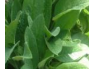
コンフリーエキス